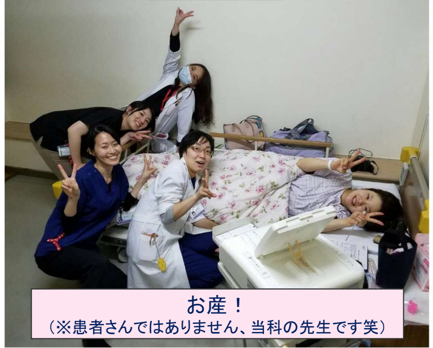
お産！ (※患者さんではありません、当科の先生です笑)