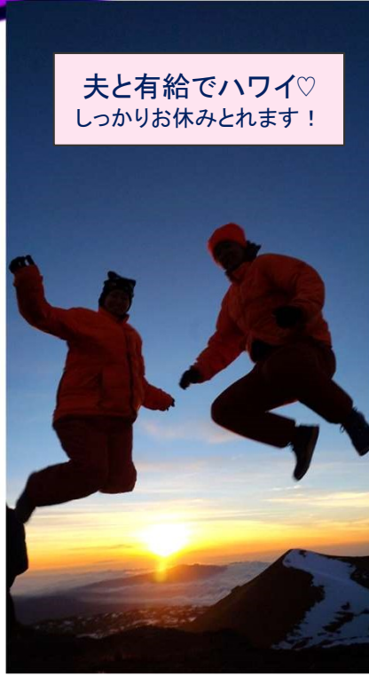
夫と有給でハワイ♡ しっかりお休みとれます！